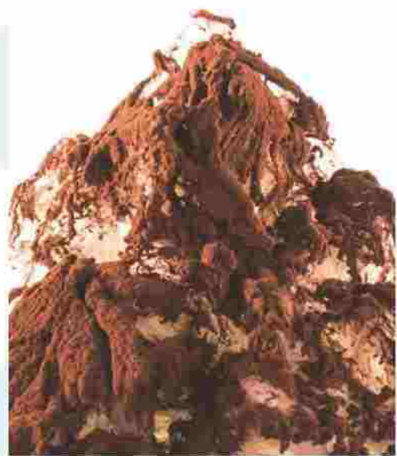
○ティラミス 800円(税込) ココアパウダーとマスカルポーネをたっぷり使って、かき氷が極上のスイーツに。

KAKIGORI CAFE&BAR yelo 港区六本木5-2-11パティオ六本木1F