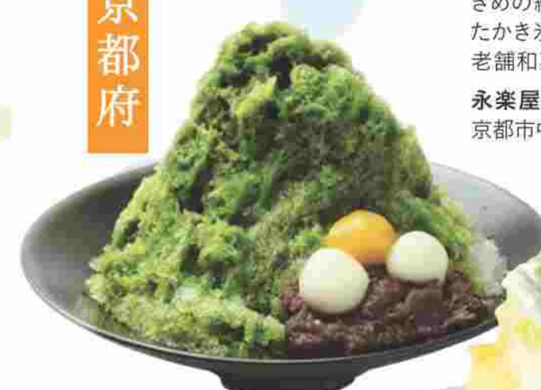
○宇治金時氷 1,080円(税込)(販売:5/1~9/30) きめの細かいフワッとした氷に、特製宇治室をかけたかき氷。もっちりとした白玉、上品な甘みの小豆も老舗和菓子店ならではの。