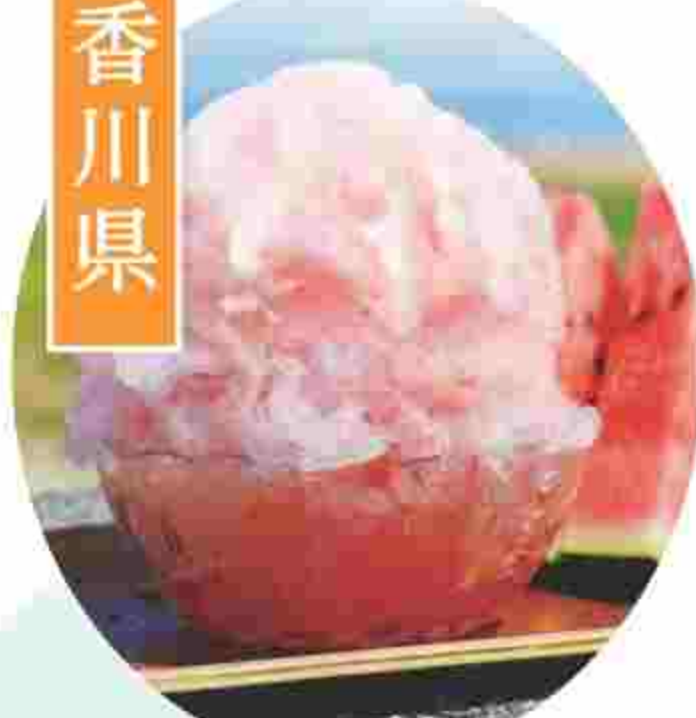
○かき氷生すいか(財田産) 750円(税込) (販売:8月上旬~8月末頃) 三豊市財田産の獲れたてすいかを贅沢に使用したシロップ仕立て。氷の中にもカットされたすいかが隠れた地産地消氷。