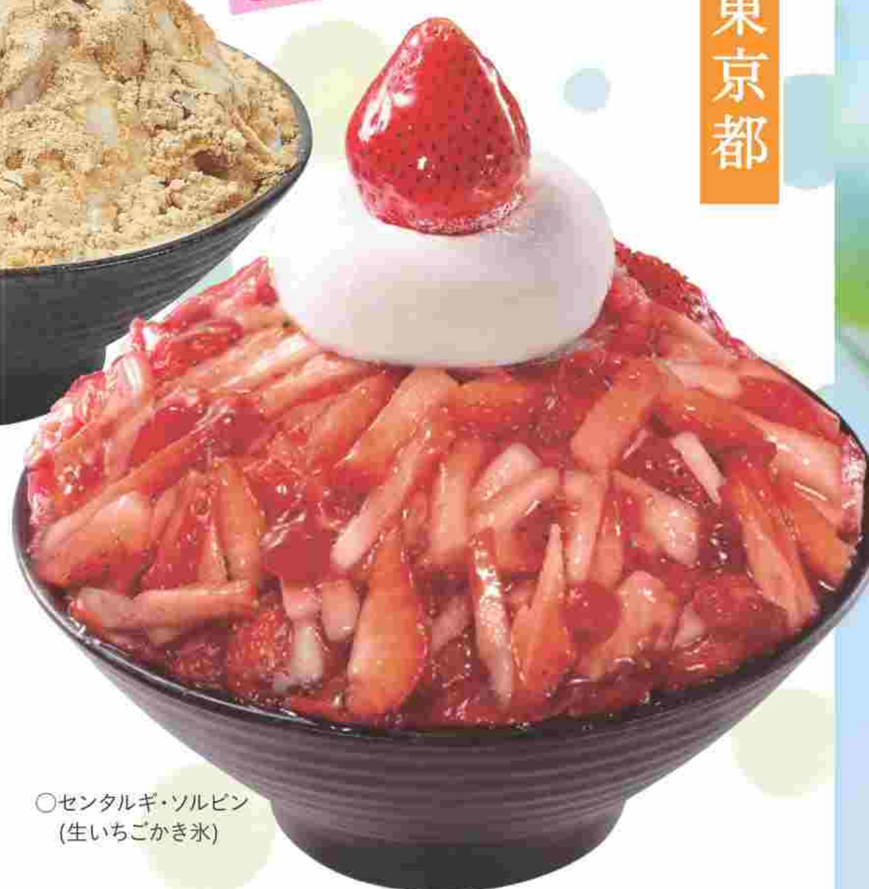
○セントルギ・ソルビン (生いちごかき氷)