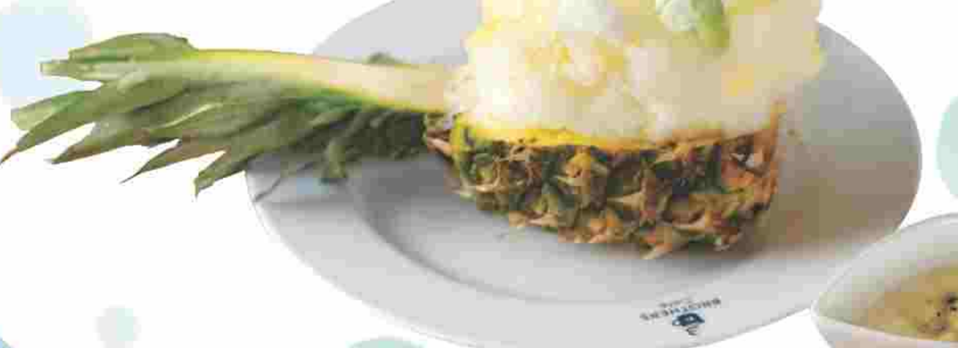
○まるごとパイン 980円(税込)(夏期限定) 新鮮なパインを贅沢に使った究極のスイーツ。今年は、かき氷の上にキウイのエスプーマをかけ、アロエベラ、キウイ、パインをのせてパワーアップ。

ブラザーズカフェ なんば店:大阪市浪速区難波中1-17-13 梅田OPA店:大阪市北区茶屋町1-27 梅田OPA BIF