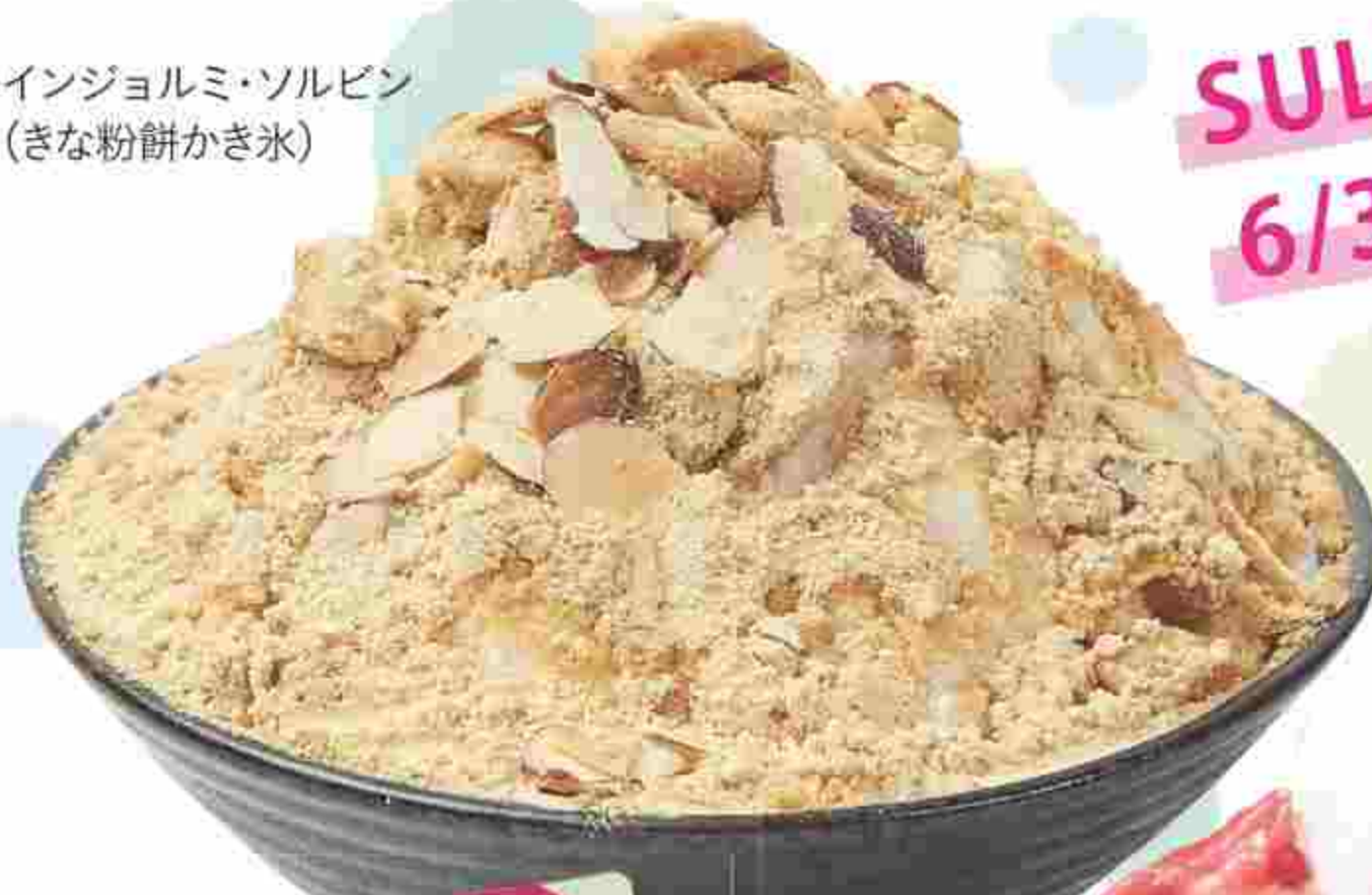
○インジョルミ・ソルビン (きな粉餅かき氷)