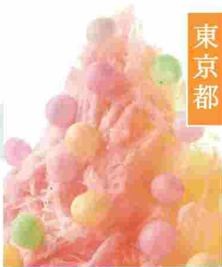
○パステルズ 950円(税込)(夏期限定) ローズとバニラで紅白にあしらひ、則ち包商店製・香川の伝統和菓子おいりを降らせて。

KAKIGORI CAFE&BAR yelo 港区六本木5-2-11パティオ六本木1F